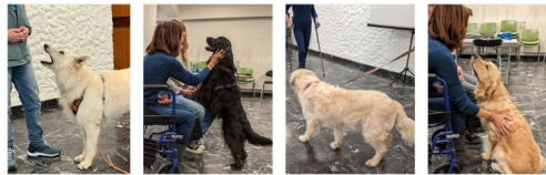
Dernière session de tests 2023

Quels profils de chiens pour les visites ?