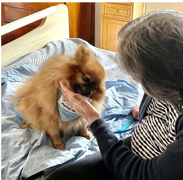
Pépité à Arpavie Les Clairières