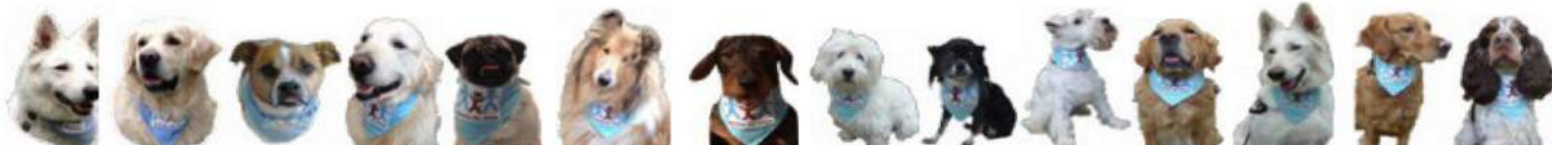
Filo Earley Ficelle Cobalt Fiona Flamenco Helmut Gaïa Harry Schilgi Gadget Iris Ivy Jelfy

Un grand MERCI au magazine des seniors, Notre Temps, qui a, pour sa 6ème édition, décerné le Prix des Héros 2016 à 5 associations dont Parole de chien. Une belle reconnaissance pour la mission exigeante des bénévoles qui apportent douceur et réconfort avec leurs chiens aux personnes âgées les plus isolées.