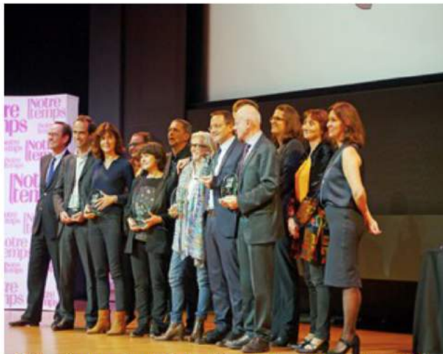
Cérémonie de remise du Prix Les Héros de Notre Temps octobre 2016

Un grand MERCI au magazine des seniors, Notre Temps, qui a, pour sa 6ème édition, décerné le Prix des Héros 2016 à 5 associations dont Parole de chien. Une belle reconnaissance pour la mission exigeante des bénévoles qui apportent douceur et réconfort avec leurs chiens aux personnes âgées les plus isolées.